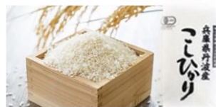
有機JAS認定兵庫県産コシヒカリ2kg